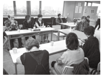
▲講座終了後、講師を交えて懇談する様子