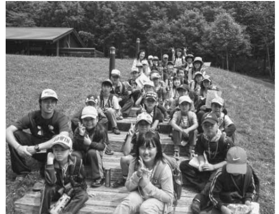
ちょことバス遠足

平成24年度より取り組んでいるふれあい地域塾は、教育の中核となる学校を軸に、保護者や地域の方が意識的に学校教育に関わることにより、学校・家庭・地域の絆が一層強められるとともに信頼関係をさらに深め、「地域の子どもは地域で育てる」という地域一体型の教育環境のもとに子どもに生きる力を育むことをねらいとしています。夏休み(3日間)・冬休み(2日間)の休業期間を利用し、地域ボランティア、学校の先生などの協力を得ながら学びの時間、英会話、工作・手芸体験、軽スポーツ、自然観察など様々な体験活動を行っています。子どもたちは、地域の大人と交わりながら、学習や様々な体験活動を通して人間関係を学び、地域への愛着を深め、生き方の視野をひろげています。また、参加した大人にとっても地域の子どもを学校とともに育てていくという意識向上に繋がっています。今後も工夫改善を図りながら豊かな地域コミュニティの形成と子どもに生きる力を育む活動として深化させていきたいものです。